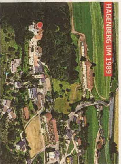
● Schloss Hagenberg

Ich übersprünge die letzten sechs Jahre, in denen es keine wissenschaftliche Leitung gab – was allen wurscht war. Was ich anklage! Das war, verglichen mit dem, was hätte sein können, ein Schritt zurück.